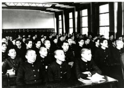
1935 年頃の 1-403 教室