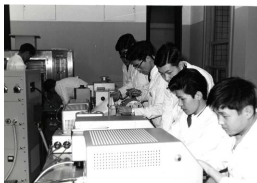
ドイツから寄贈された分光光度計(ツァイス社)で実験する学生(1963年)