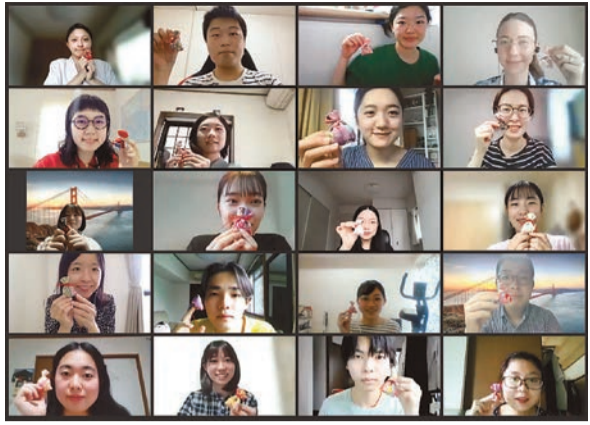
製作指導を受け、各自がオリジナルの香りに調合した匂袋を手に記念撮影

6月8日、Sophia Student Integration Commons (SSIC) が主催「匂袋製作体験」が