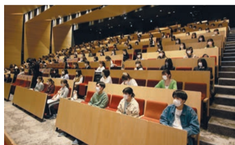
参加した高校生で満員の会場