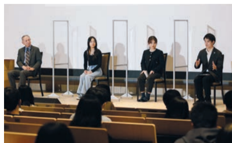
睡道学長と在学生3人のトークセッション

在學生と考える「個性を磨く学び」が開催された。このイベントは、9学部29学科が集結し、80カ国以上からの学生が集う本学のGlobal One Campus（グローバル・ワンキャンパス）の魅力を受験生にアピールする目的で企画された。