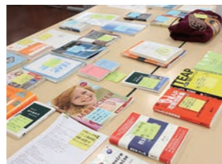
上智生が実際に使用していた参考書や普段使用している教科書やアイテムを展示しています!