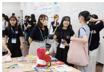
様々な学部・学科の学生が集まっています!