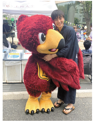
上智大学の名物行事 浴衣デーのときに、 ソフィアンくんと一緒に 撮った1枚です!