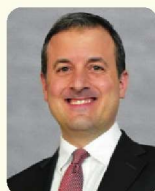
リチャード・ポンジオ博士