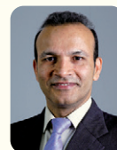
サリ・アガスティン教授