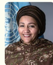
アミーナ・モハメッド氏