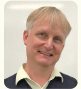
ローレンツ・ポグゲンドルフ准教授