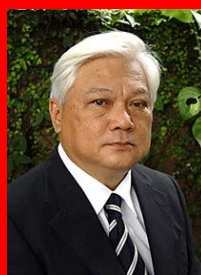
チャヤン ・ヴァダナプティ 教授

一方で、高等教育機関においては、従 来の学問体系の枠組みを維持しつつも、 複合領域的な学びの機会の創出が試 みられている。「持続可能な社会」とい う国連が提示した考え方に、大学はど う向かい合うのか。本シンポジウムでは、 国内外の高等教育機関でESDに取り組 む専門家を招聘し、この問いについて 議論したい。」