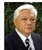
チャヤン・ヴァダナブティ教授