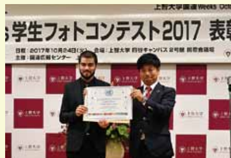
昨年の表彰式の様子

https://communityassignments.gettyimages.com/ja/community-assignments/sdgs2018/