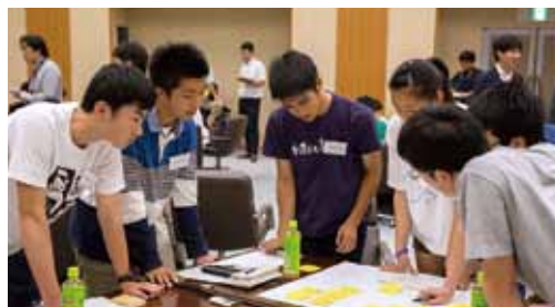
未来メディアカフェでのワークショップの様子