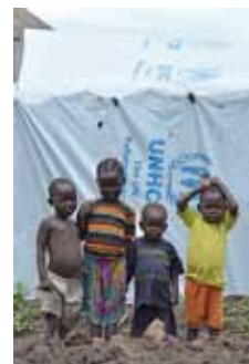
ウガンダの難民キャンプに暮らす南スーダン難民の子どもたち