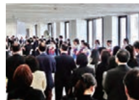
(参考)2019年度新入会員歓迎会

後援会では、会員を対象とした懇親会を年に数回開催しています。この懇親会には、父母・保証人の会員だけでなくご家族の方も出席されて、会員同士あるいは来賓の理事長、学長、副学長、学部長など教員の方々と歓談し、親睦を深めています。また、教員による講演会も開催しており、会員の皆様に大変ご好評いただいております。