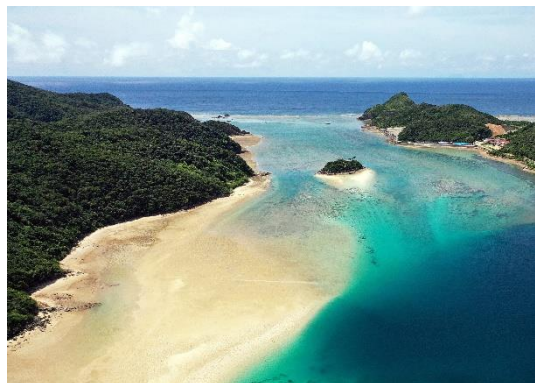
マングローブを植林する枝手久島(左)