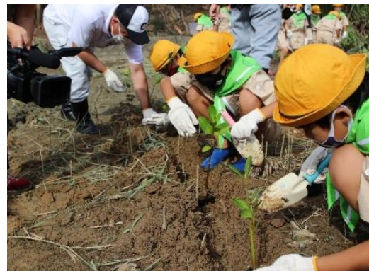
地元小学生による植林(2021年)