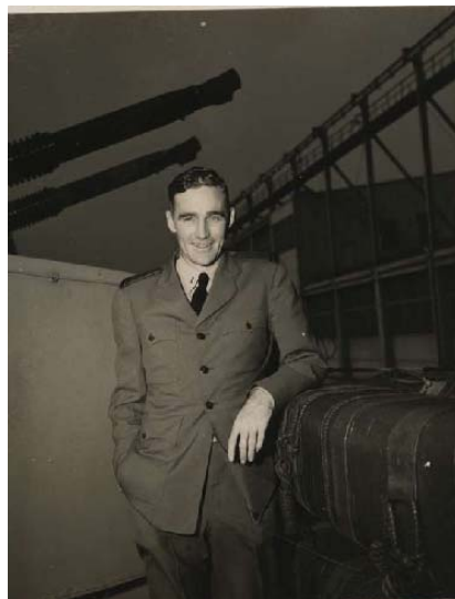
上智大学にやってきたポール・オコンノーSJ、後にアメリカのザビエル大学学長となる

ブルウェット神父は教育学科で、フォーブス神父は英語学科で教鞭をとった。ミラー神父は英文学を教え、また国際部の設立にも尽力した。マッコイ神父は生物学の授業を担当した。その後は全世界から多くのイエズス会員が上智大学に派遣された。第7代学長ヨゼフ・ピタウ神父、第12代学長ウィリアム・カーリー神父などのイエズス会員が派遣され、上智大学の精神的な発展の支柱となった。