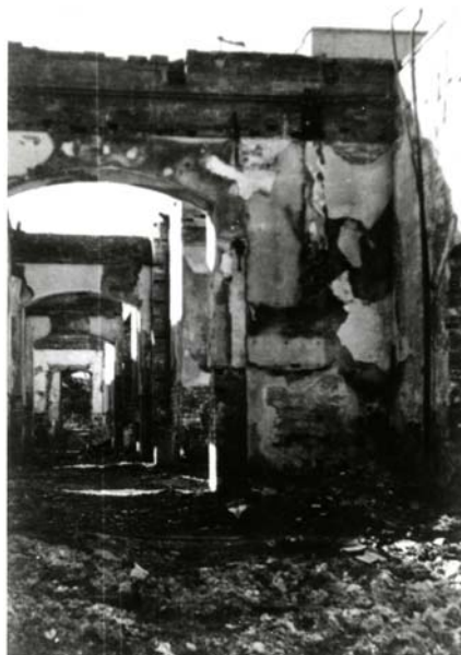
1945年4月13日未明の大空襲で焼けた赤レンガ校舎(上)と4月15日の朝日新聞記事(下)